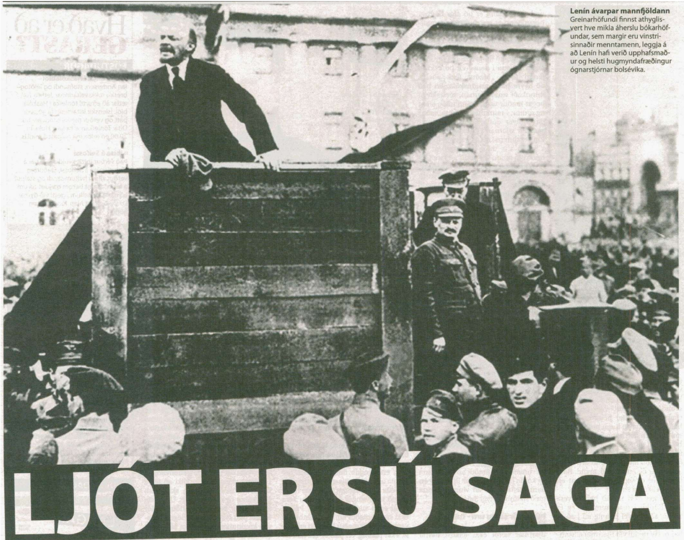
Lenín ávarpar mannfjöldann Greinarhöfundurinn finnst athyglisvert hve mikla áherslu bókarhöfundar, sem margir eru vinstri-sinnaðir menntamenn, leggja á að Lenín hafi verið upphafsmaður og helsti hugmyndafræðingur ógnarstjórnar bolsévika.